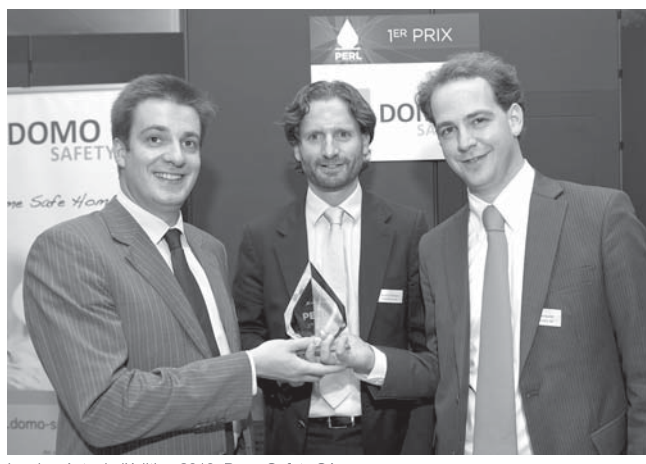
Les lauréats de l'édition 2013, DomoSafety SA