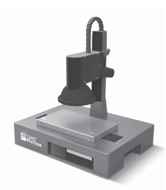
QMTProTime: Equipement de mesure de la marche diurne de montres terminées et de mouvements

Fondée en 1989 par un groupe d'ingénieurs, Qualimatest est spécialisée dans la réalisation de solutions pour le contrôle de qualité. Ses équipements sont conçus pour des produits manufacturés issus de divers secteurs industriels, dont les plus conséquents restent l'horlogerie. l'automobile, le médical et le ferroviaire, La PME genevoise, qui emploie aujourd'hui 17 personnes, est particulièrement recherchée pour ses systèmes dotés de caméras permettant un contrôle des produits sans manipulation. Leur application peut aller du contrôle de pièces de mouvements horlogers calibrés à la vérification de pétales de céréales après cuisson. Cette technique, entièrement automatique, présente l'avantage de traiter rapidement des volumes de production importants.