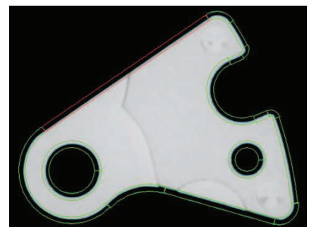
Mesure des contours extérieurs, localisation des erreurs